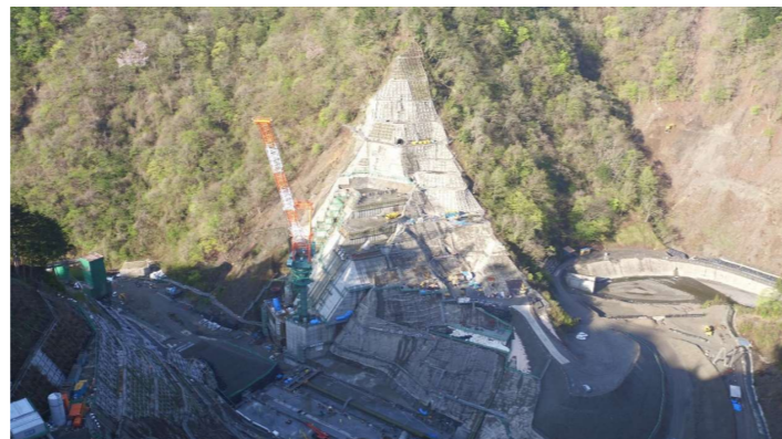
② ダムサイト右岸状況(左岸上空より望む)