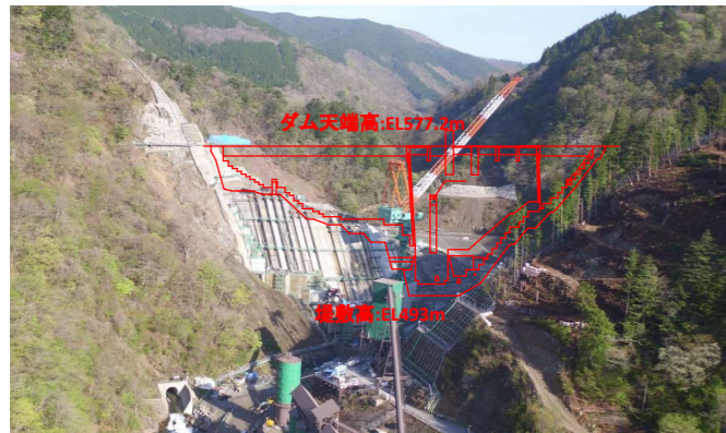
① ダムサイト状況(下流上空より望む)