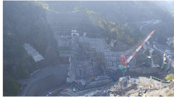
③ ダムサイト左岸状況(右岸上空より望む)