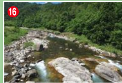
16 下向山橋の上流を見る。岩盤と落ち込みが多い