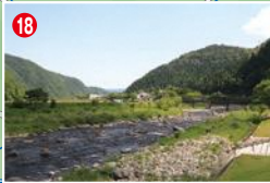
18 清流長良川あゆパークの裏。意外なほど魚が濃い