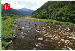
17 向山橋より上流は平瀬が続く