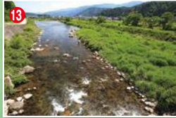
13 大芝原橋より下流。この辺りから天然は少なくなる