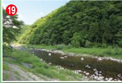
19 初心者も釣りやすいトコが続く