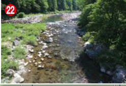
22 郡上谷橋より下流を見る。この辺りが郡上アユ釣り場の最上流といえる