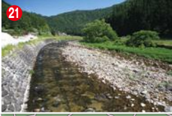
21 下向橋より上流を見る。護岸帯の瀬が続く

高鷲地区になると最上流部のため釣期は短いがお盆明けのころになると時に長い間釣り人が居らずサオ抜けとなって大型の入れ掛かりなんてこともあるので侮れない。丁寧に川見して入川するとおもしろい。