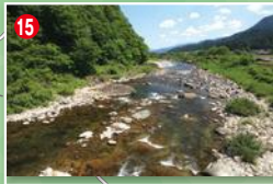
15 下向山橋の下流。初期から8月までのポイント