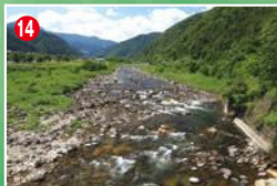
14 大芝原橋の上流。変化に富む瀬を拾い釣りて探りたい