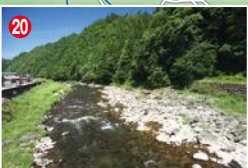
20 平家平橋より上流を見る。段々と溪流相になる