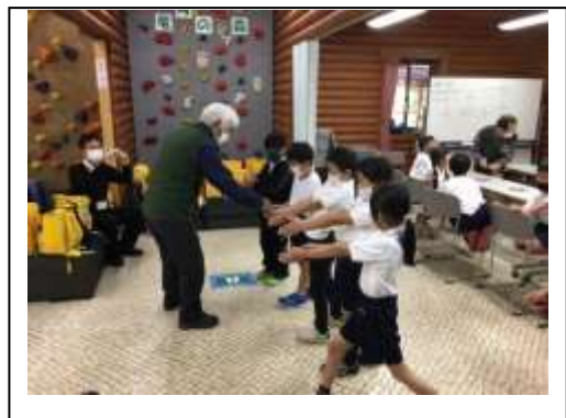
自然ふれあい館で竹とんぼを飛ばす1・2年生（生活科学習）