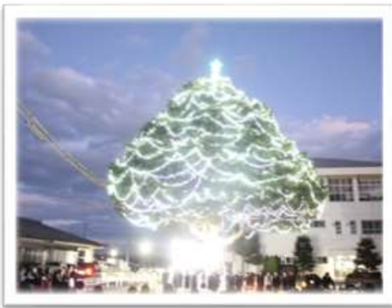
「西部地区イルミネーション点灯式」

学校運営協議会・地域学校協働本部的な役割 ◎学校、家庭、地域で願いを共有 「誰もが大切にされるふるさと」 ◎願う姿を実現するための具体的な共通実践行動 ①安全・安心な学校と地域づくり ・地域ボランティアによる登校見守り ・地域クリーンアップ&防災訓練 ②ふるさとのよさを実感する体験活動 ・シンボルツリーイルミネーション点灯式と発信 ・地域からの健全育成標語の募集と啓発 ・ふれあいセンター等活動の参加・参画 ◎これまでの成果 ○地域と学校、PTA とが一体となった、子どもの健全育成「地域と共にある学校」 ○子どもたちの自己有用感と地域への愛着の高まり ・令和3年度キャリア教育文部科学大臣表彰 ・令和3年度岐阜県学校安全優良校 ・令和3年度岐阜県道徳教育奨励賞優秀校