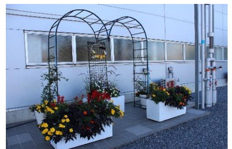
【喫煙所跡地の花壇】

また、喫煙者は50代を過ぎると生活習慣病に罹患する確率が高くなる傾向があるとも言われるため、今後は生活習慣病の防止等健康面での効果が現れることを期待しています。