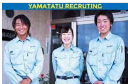
新卒採用募集開始! ~地域密着型・環境密着型・技術の中心にこだわります!~