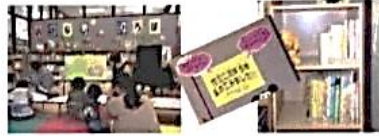
読みきかせ・育児に関する本コーナー (図書館)