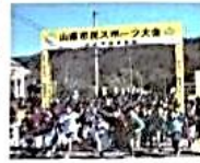
スポーツ大会・ラジオ体操の様子