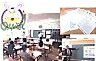
放課後子ども教室の様子