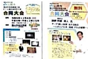
青少年・PTA連合会合同大会