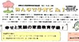
岐阜地区家庭教育学級応援通信