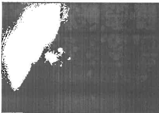
ドローンを活用した点検の様子