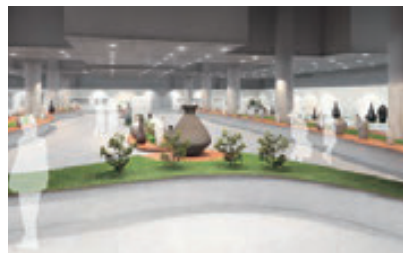
▲今回展示会場イメージ

岐阜県多治見市のセラミックパークMINOをメイン会場に東美濃地域全体で開催する陶磁器の祭典。国際陶磁器展美濃では、過去最高となる64の国と地域から2,435作品の応募があり、国内外の10名の著名な審査員による厳しい選考を通過した178作品が展示会場に並びます。既成の概念にとらわれない、素晴らしい作品の数々をお楽しみください。