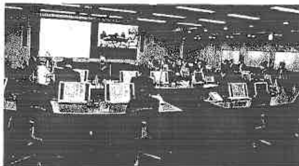
原子力安全検証委員会の様子

○安全への取組みを不断に実施しているか等について、法律、原子力、品質管理、安全等、それぞれの分野の有識者から、自由にご意見を述べていただき、継続的な改善に支えられた安全の確保をより確実にする場としている。