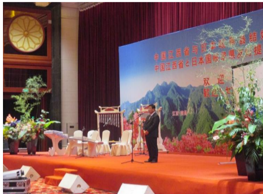
江西省でのレセプションにおける県産花きの展示(2018年11月)

更なる友好交流を促進するため、2018年11月、「花き産業に関する覚書」(岐阜県園芸特産振興会花き部会—江西省花卉協会)を締結。