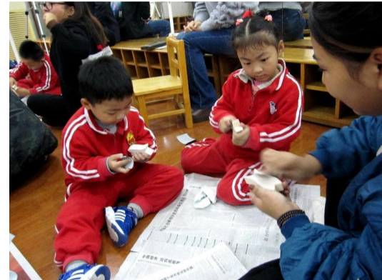
江西省人民政府直属機関第二保育院にて木育教室を実施(2018年11月)

更なる友好交流を促進するため、2018年11月、「林業分野での交流促進に関する覚書」(林政部—江西省林業局)を締結。