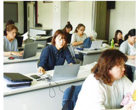
ライフプランの研修(リーダー育成塾)

研修等を通じ、経営管理能力に優れた女性農業者の育成を図ります。併せて認定農業者をめざす女性農業者に対し、経営改善計画の作成や経営を確立するための技術指導や経営支援を行います。