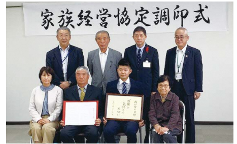
家族経営協定調印式(岐阜地域)

研修会等を通じて家族経営協定の周知と理解を図ります。また、個々の経営体の新規就農や経営継承および認定農業者の申請時の機会をとらえ、家族経営協定の締結に向けた働きかけを行います。