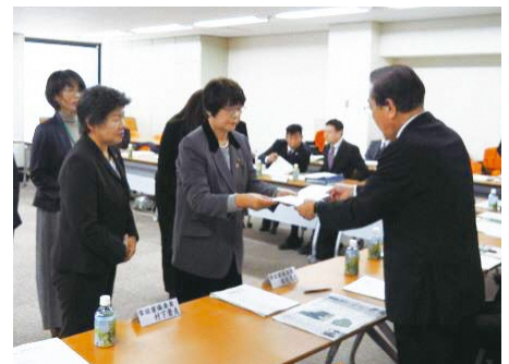
女性農業委員登用の要請

農業分野の審議会等への女性の参画について、女性のリーダーを育成し、一層の参画拡大を推進します。