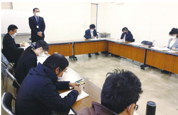
ぎふ農業・農村男女共同参画推進会議