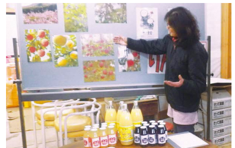
6次産業化の商品の説明

GAPのリスク評価を基にした安全な作業の実践や、スマート農業機器を利用した身体への負担の軽減や作業の省力化につながる環境整備を推進します。