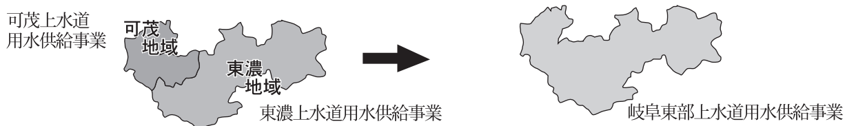
事業統合のイメージ図

なお、給水規模は、創設当時の6市4町の約28万人から、約35年を経過した現在は、7市4町の約50万人の生活用水を供給するまでに至っている。