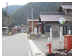
スタート地点 (横蔵バス停)