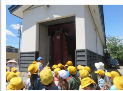
『地域防災学習』 大宮陸間