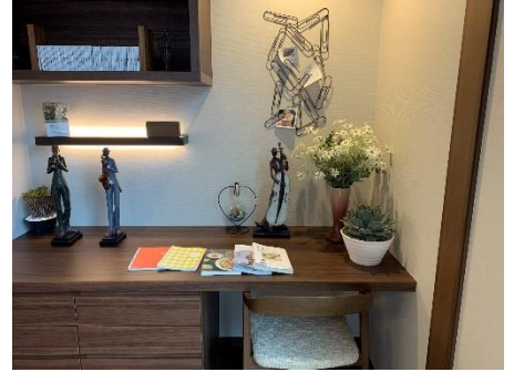
花のある暮らしの提案