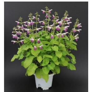
アキギリの鉢花用品種 「ミライパープル」