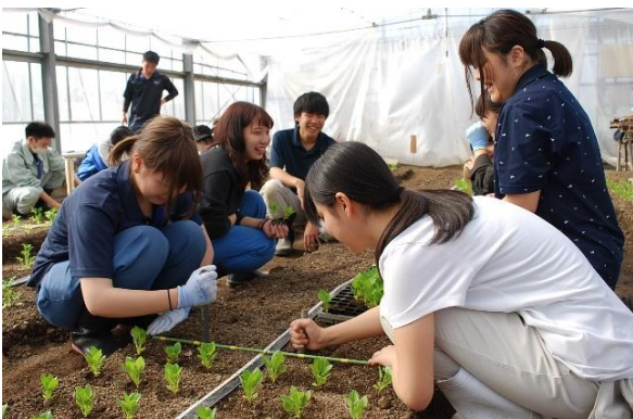
国際園芸アカデミー生産実習