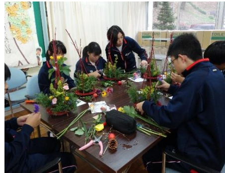
花育講座(フラワーアレンジメント)