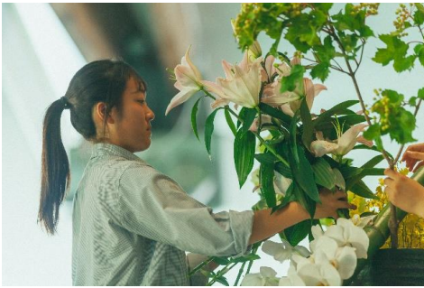
高校生花いけバトル「花きの日大会」