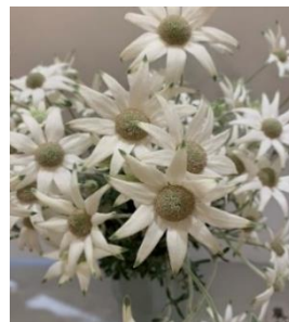
フランネルフラワー 「ファンシーマリエ」