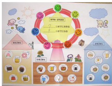
【せいかつリズムカード】