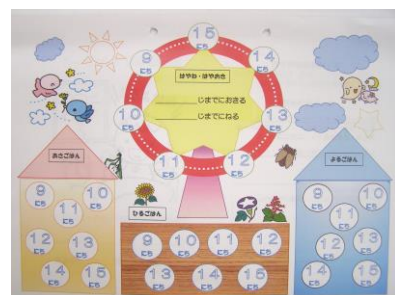
【せいかつリズムカード】