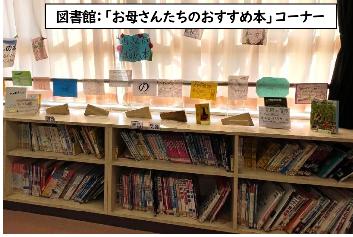
図書館：「お母さんたちのおすすめ本」コーナー

また、各務原市では図書館の職員やボランティアによる読み聞かせが各学校で行われていますが、今年は対面での読み聞かせはあまり行われていないため委員さんで朗読をしたそうです。さらにその様子をビデオに撮りデータを各教室に置き、電子黒板でいつでも視聴できるようにされました。(レシピの通信は2ページに掲載)