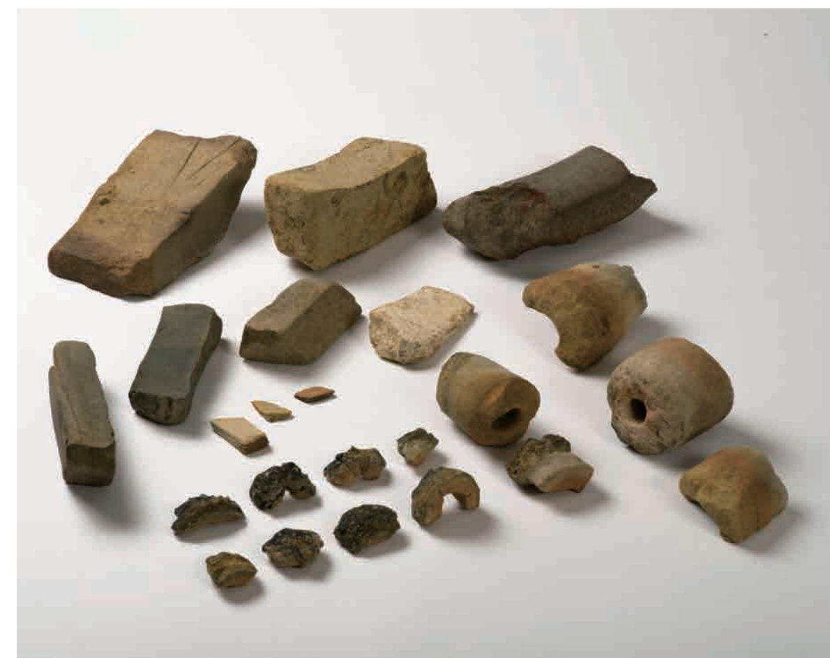
中世の鍛冶関連遺物

左の写真は、発掘区南西部で確認した居住域の西辺を区画する溝です。区画溝は、発掘区の南東隅で同規模の溝を確認していることから、溝の東側が区画の中心であったと考えられます。鎌倉時代の終わり頃に作られ、室町時代に写真に見るような幅 3m を超える規模の溝に作り替えられました。