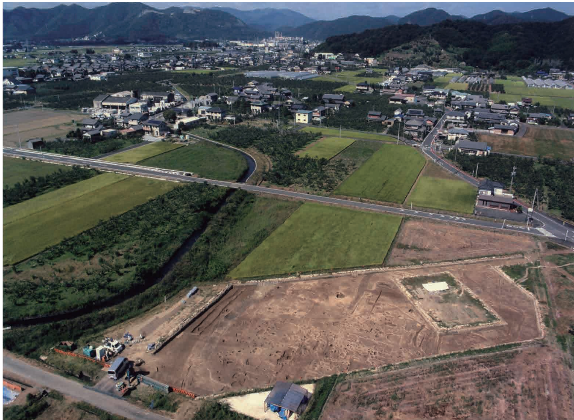
平成 27 年度の調査（4 地点）

上保本郷遺跡は、濃尾平野北縁部に立地する遺跡です。遺跡の北側には国史跡「船来山古墳群」があります。平成 27 年から平成 29 年まで発掘調査を行いました。