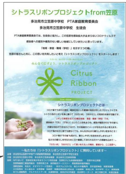
シトラスリボンプロジェクトのチラシ

「コロナ禍の差別や偏見をなくす」という思いは、思っているだけでは伝わりません。シトラスリボンを身に付けることで、意思表示になります。「コロナ禍だから何もやれない」ではなく、「コロナ禍だから何かをやる」という家庭教育委員会の思いは、シトラスリボンとなり、今、地域の方や子ども達のカバンで揺れています。