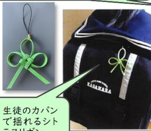
生徒のカバンで揺れるシトラスリボン