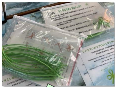
シトラスリボン手作りキット

笠原地区は、地区の伝統行事「いこまい祭り」の踊りの練習に300人も参加して取り組んでいる、人と人とのつながりの深い地域です。笠原中学校家庭教育委員会から始まったプロジェクトは、笠原地区の地域愛が支えとなって、全校へ、地域へ、多治見市へと広がっています。