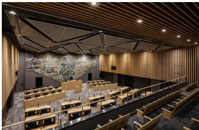
7・8階議場及び傍聴席

所在地：大垣市丸の内2丁目29番地 電話番号：0584-47-7439 完成：令和元年10月 施設用途：行政施設 木材使用箇所：天井ルーバー、壁ルーバー