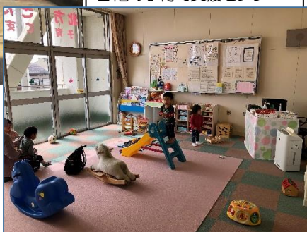
2階の子育て支援センター