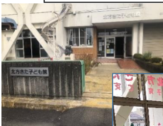
入りやすい環境の北方きた子ども館

子どもたちのために何かできないかということで休館中に、いろいろ考え、小学校に遊びやクイズなどの紹介を手作りで作成し、プリントを配布するほどの熱意です。その意欲の表れが今回2回目になるZoom配信です。最初はかなり準備や練習をされてそのノウハウが活かされての今回です。表現のうまさや配信画面を予想してのカメラの位置等びっくりするほど見やすく聞きやすい状態でした。子どもが目の前にいる事をイメージしての動きはさすが保育士さんですね。できることを使って何ができるだろうといった工夫は、願いがあってできるものだと感じました。