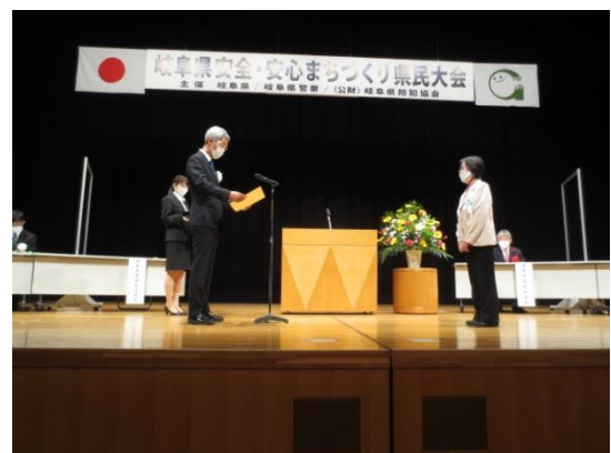
（環境生活部長より表彰状を授与）

地域の環境整備と地域住民とのコミュニケーションを図るため、社員による道路清掃活動と安全パトロールを実施。