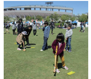
グラウンド・ゴルフ体験の様子

グラウンド・ゴルフの体験やスタンプラリーなど、子どもから大人までどなたでも楽しく体を動かしながら健康づくりにつなげることができるイベントを開催します。岐阜会場では、飛騨牛などが当たるビンゴ大会や、○×クイズといったステージイベントなども実施します。参加は全会場無料です。