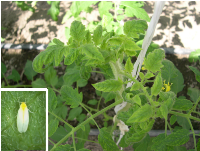
トマト黄化葉巻病とタバココナジラミ(左下)

そこで、当センターでは、このウィルス病を媒介するタバココナジラミの物理的な手法（防虫ネットや粘着テープ）を使った防除法の効果を検討しました。