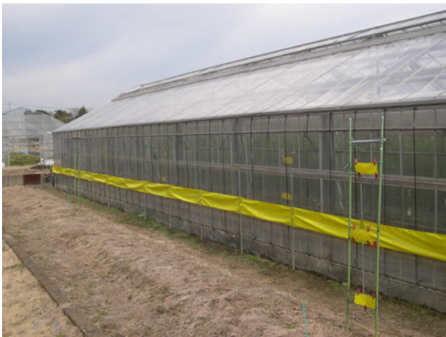
黄色粘着テープのハウス外展張