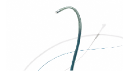
中心循環系マイクロカテーテル