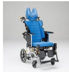
チルト・リクライニング車いす