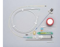
長期的使用注入用植込みポート