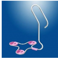
立ち上がり補助具