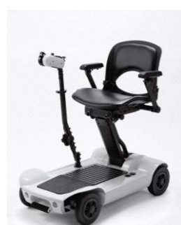
折りたたみ電動車いす