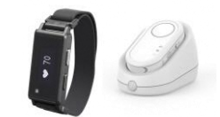
24時間オンライン脈拍測定システム