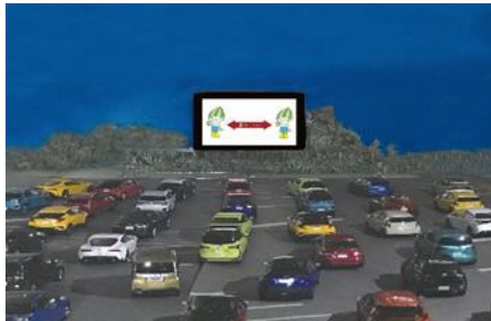
Kaliwa: Yoro Park 140 Anniversary Logo Kanan: Drive-in theater (Image)

Sa pagdiriwang ng ika-140 anibersaryo ng Yoro Park, gaganapin ang iba't ibang mga kaganapan tulad ng projection mapping, decentralized stage, drive-in theatre, open café, at iba pa na mai-enjoy sa Autumn weekends na naayon sa COVID countermeasures.