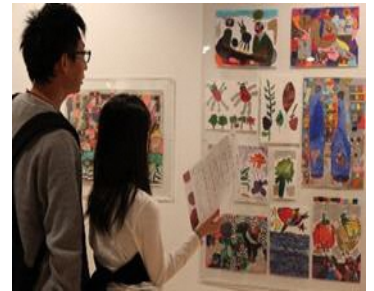
Eksibisyon noong nakaraang taon

Sa pamamagitan ng sining (art), isasagawa ang mga hakbangin upang mapagkaisa ang lipunan at mga taong may kapansanan sa pakikipagtulungan ng mga kumpanya at mga eksibisyon na nagpapakilala sa mga gawa ng mga artist sa prepektura.