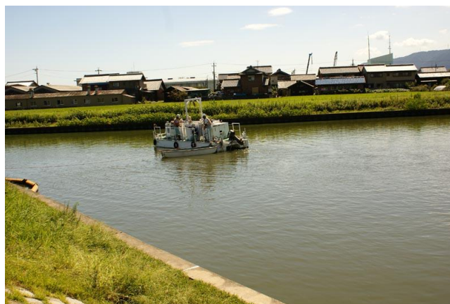
写真－2 水質対策船による攪拌(H24 実施)