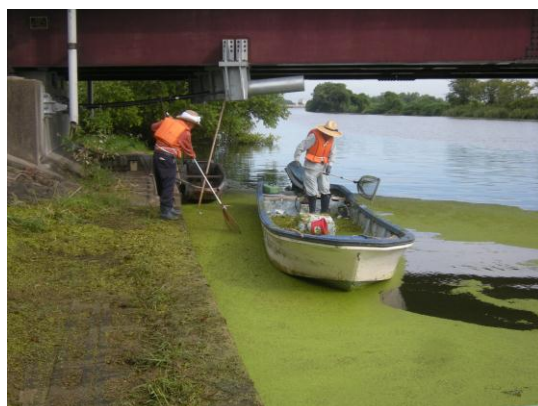
写真－3 ウキクサ回収状況 (H26 実施)