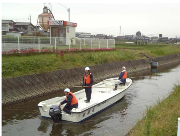
写真－1 モーターボートによる攪拌(H23 実施)

海津市所有の小型船（モーターボート）や、必要に応じて国土交通省中部地方整備局木曾川下流河川事務所所有の水質対策船を借用するなどして、攪拌を行う。(H23, 24 実施)