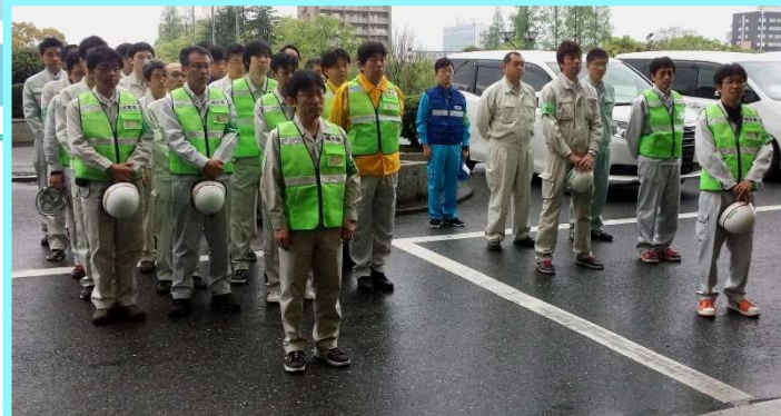
被災地への 建築物応急危険度判定士派遣