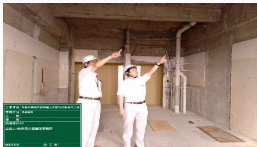
県立高校改修工事の現場確認