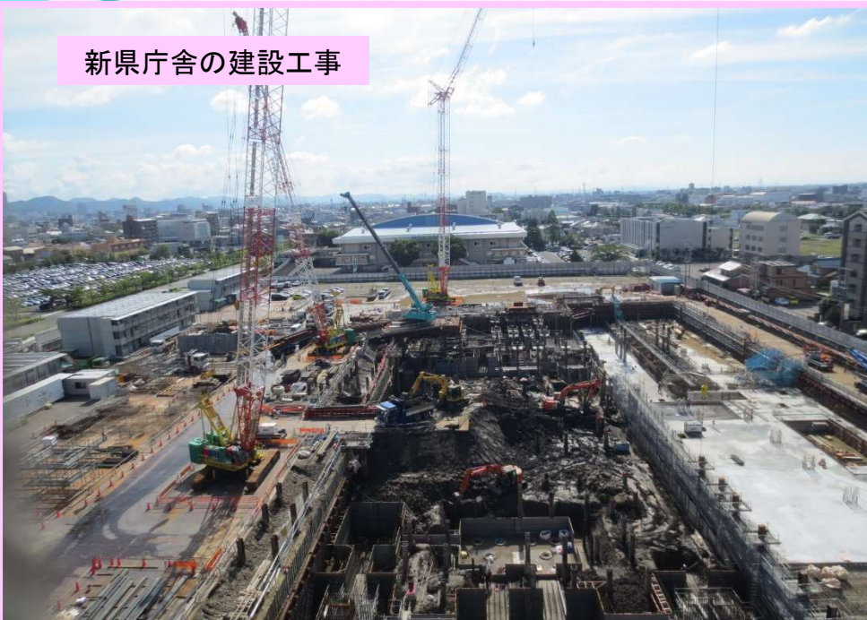
新県庁舎の建設工事