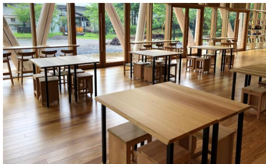
交流・企画展示スペース