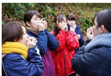
保育士の卵(大学生)の森林体験