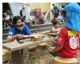
子どもの自由な遊びを応援 週末プレーパーク