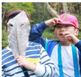
小学校の森遊び活動