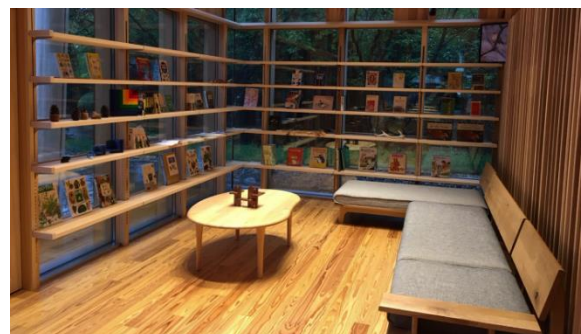
図書閲覧スペース