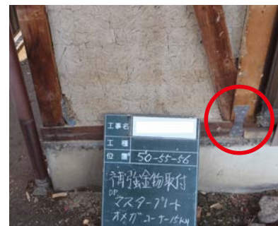
▲金物による接合部の補強