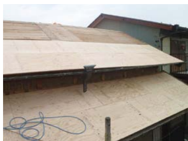
▲合板による屋根面の補強