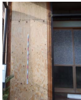
▲構造用合板による壁の補強