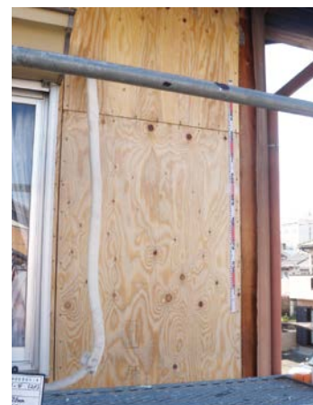
▲ 構造用合板による壁の補強 (外側から)