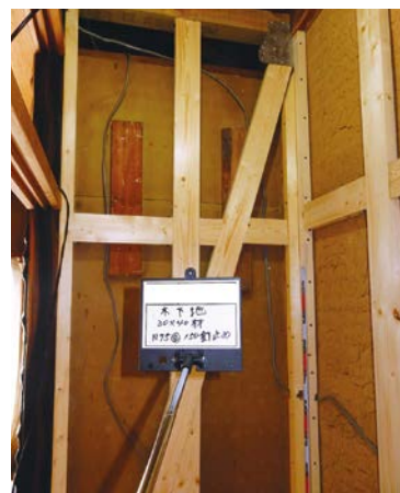
▲筋かいによる壁の補強