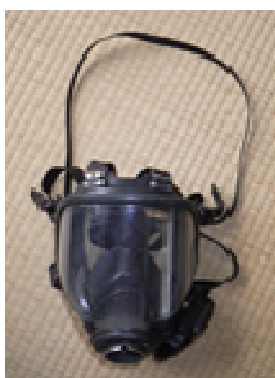
[空気呼吸器用面体]

(款) 2 総務費 (項) 6 防災費 (目) (2) 消防指導費 (明細書事業名) ○消防学校費 学校運営費 教養訓練費