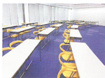
第1・2会議室 (パーティー開放時)