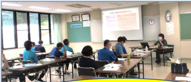
〈施設長様あいさつ〉