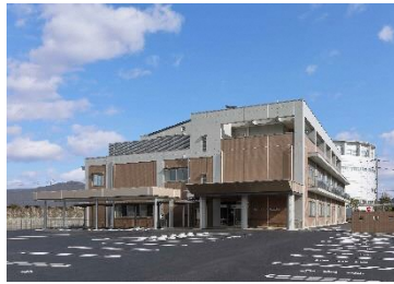
县残障人士综合就业支援中心外观

为帮助残障人士就业，把县残障人士综合就业支援中心设置在支援残障人士的基地岐阜清流福祉ERIA内，于4月份开业。