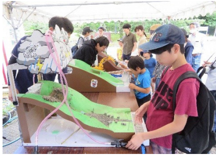
Sabo Fair noong nakaraang taon

Isasagawa ang "Landslide (Sabo) Prevention Month" sa Hunyo dahil ito ang panahon ng tag-ulan at dito tumataas ang panganib sa pagguho ng lupa.