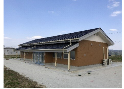
Smart Agriculture Promotion Base Operation Center

Ang prefecture ay nagtaguyod ng "Smart Agriculture" upang higit pang mapabuti ang produksyon at kakayahang kumita ng agrikultura sa Gifu.