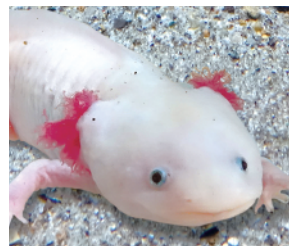
ウーパールーパー

エリマキトカゲやウーパールーパーなど、メディアなどで話題になった懐かしい生きものを集めて、過去から現在まで年代ごとに展示します。小さなお子さんはもちろん、大人の方も楽しめます。