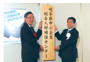
県中小企業総合人材確保センター開所式

4月に開設された県中小企業総合人材確保センター(ジンサポ!ぎふ)。県内企業の採用力向上や、働きやすい職場環境づくりの支援、県内外に魅力をPRする機会を提供するなど、企業の人材確保を強力に後押しするのが狙いです。人材確保に関する総合拠点として、さまざまな支援を行っていきますので、ぜひご活用ください。