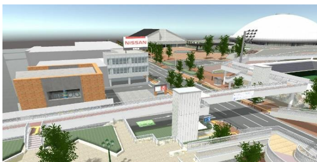
Ilustração da passarela