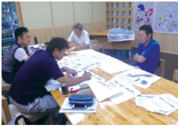
市町村森林整備計画策定演習

岐阜県地域森林監理士は、森林の管理と経営に関する一定水準の知識や、技術を持つ人材。養成から認定まで行う岐阜県独自の取組みです。市町村行政への支援や民有林経営への助言など、活躍が期待されています。今後5年間で15人の認定を目指しています。