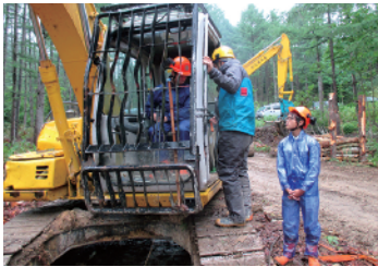
木材を運ぶ機械の操作体験

森林課程がある県内の高等学校の生徒を対象に、職場体験(インターンシップ)を順次開催。実際に林業という仕事に触れてもらい、就業への意欲を高めてもらうため、間伐や木材の搬出実習などの体験を提供しています。