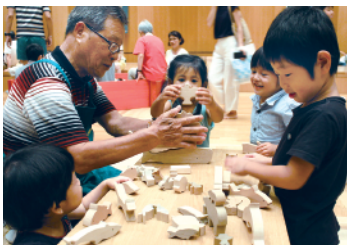
ぎふ木育キャラバン

森や木とふれあい、学び、ともに生きていく「ぎふ木育」を推進するため、育成を進めているぎふ木育指導員。木育教室や木のおもちゃで遊ぶ木育キャラバンなどで活躍中です。現在、県内各地で整備を進めている「ぎふ木育ひろば」などの運営スタッフとしても活動する予定です。