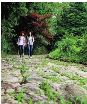
Patrimônio histórico nacional: Pavimento de Pedra Utouzaka (Nakasendo / região Mitake-cho)

Será realizada a “Caminhada pelas 17 estações” em Nakasendo e nas suas proximidades. Está sendo organizado aproximadamente 100 atividades interessantes nos 2 meses de evento.