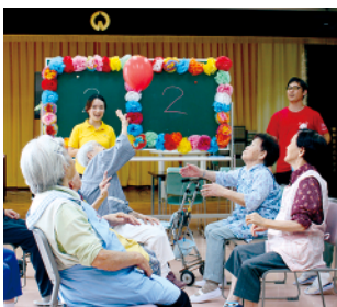
風船バレーの様子

ミナモ体操など、各種レクリエーションに積極的に取り組む学校、事業所、企業などを、レクリエーション推進団体として認定しています。認定後は認定証の交付や「脳トレミナモ体操DVD」を進呈します。レクリエーションを実践している団体の皆さんの応募をお待ちしています。