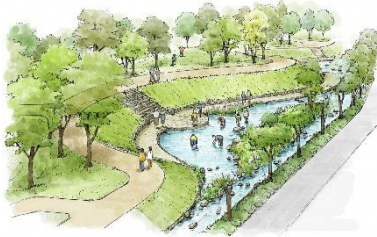
Margem do rio para brincar com os peixes (ilustração)

Neste parque, será possível experimentar a pesca do ayu através da técnica tomozuri , e outras, além de poder saborear os peixes pescados assados ao sal. Além disso, haverá uma mostra das atividades de pesca da província e o peixe "Ayu do Rio Nagara", patrimônio agrícola mundial, através de imagens e arquivos. Haverá restaurantes que oferecerão pratos com peixes de água doce também. Venham conhecer o parque.