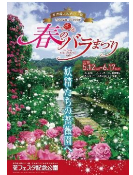
Festival de Rosas da Primavera