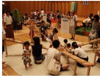
Caravana Gifu Mokuiku (Gifu Seiryu Bunka Plaza)

A segunda semana de agosto estabelecida como “Gifu Mokuiku WEEK”, terá realização de eventos a partir do dia 5 de agosto (dom) para conhecer, sentir e apreciar as montanhas e as naturezas de Gifu.