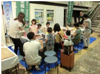
Workshop do “Festival do Dia da Montanha Gifu” (Active G)