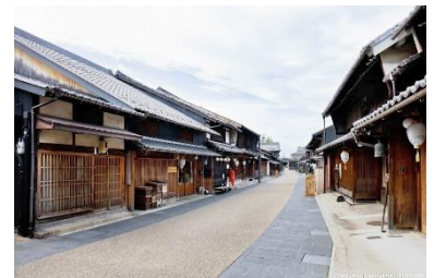
Imagens do bairro Kawara, Gifu-shi

Foi iniciado um programa experimental tipicamente da província de Gifu “Art Lab Gifu” para que os cidadãos de Gifu sintam-se próximos