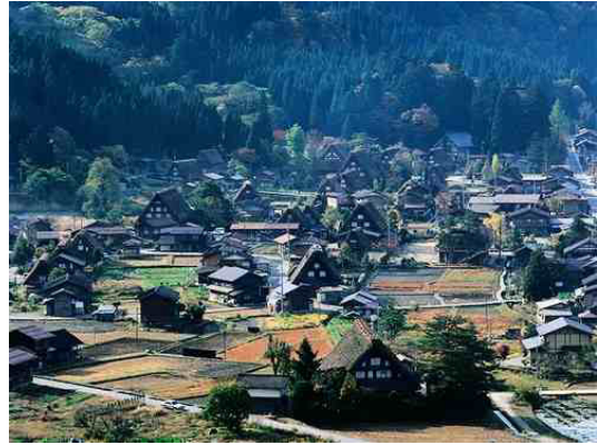
白川郷の合掌造り集落