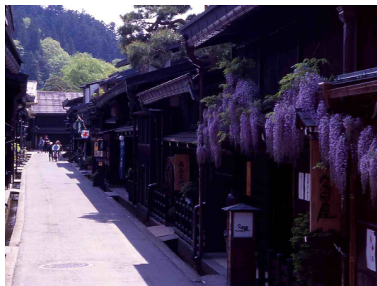
上三之町(重要伝統的建造物群保存地区)