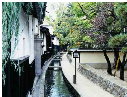
古川白壁土蔵街と瀬戸川