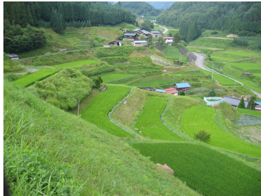
高山市郊外の田園景観