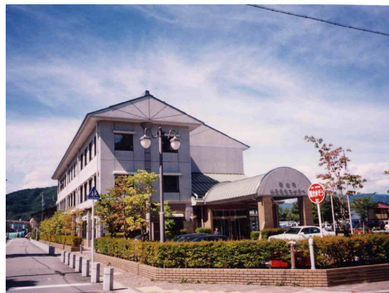
高山市の市街地景観