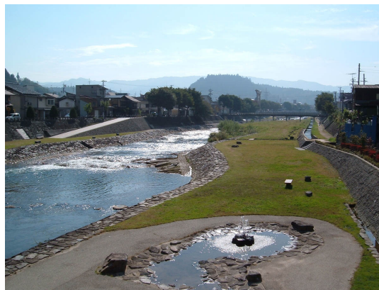
宮川水辺ふれあい公園