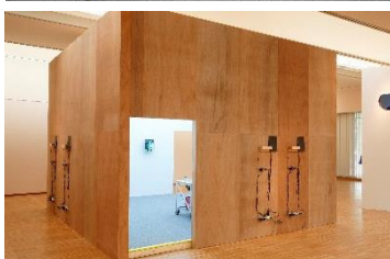
Grande Prêmio AAIC 2017 Depósito de leite + coco <<cranky wordy things>> (acima: vista interna abaixo: vista externa)

livremente em um determinado espaço. Não há restrições de idade ou modalidade, portanto, se inscrevam!